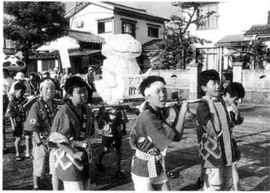
中之島第7「若草子供会」の男子のみこし