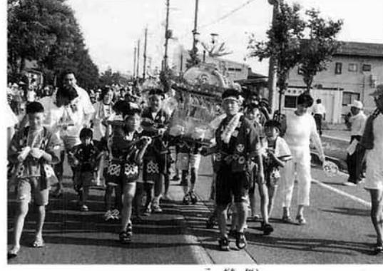
中之島第1「大屋敷子供会」中之島第3「みつば子供会」の合同みこし