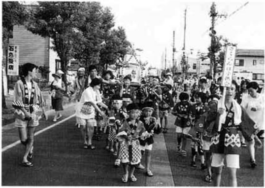
中之島第5「さくらんぼ子供会」のみこし

八月八日(日)、役場前住宅団地内公園などを会場に毎年恒例となった「第四回中之島夏まつり」が開催されました。 連日の猛暑で、この日も気温が三十五度を超え、夏の日差しが厳しく照り付ける中で実施された今年の夏まつり。 「みんなで創ろう夏まつり みんなで踊ろう中之島音頭」の合い言葉も定着し、特に昨年からはまった「子供みこし」では、昨年より五基多い、十二基の参加がありました。中でも創作みこしは、数が増えたとともに、工夫を凝らしたものがかり。そのおみこしを小さな子どもから大きな子どもまで、みんなで力を合わせて担ぐ姿に、沿道から大きな拍手がわいていました。 また、お昼にはこのほかにも「フリーマーケット」や八月十日の「道の日」を記念して行われた「落書き大会」「ジャンケン大会」などが実施されました。 そして、夜には夏まつりのメインイベントである「大民謡流し」や「御輿渡御」「太鼓の競演」などが行われ、町内外から数多くの方々が参加。夏まつりを大いに盛り上げました。