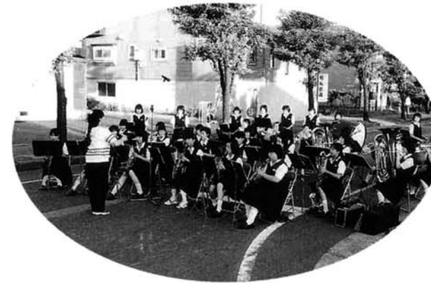
中之島中学校吹奏楽部の演奏