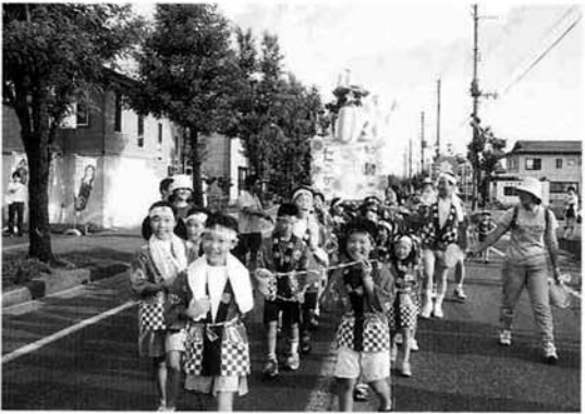
大口「はすの子供会」のみこし