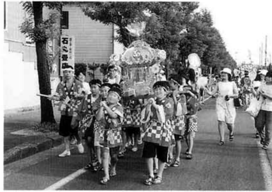
中之島第1「青空子供会」のみこし