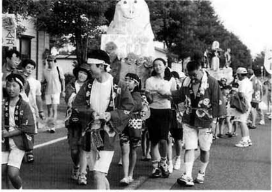
中之島第7「若草子供会」の女子のみこし