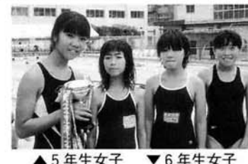
▲5年生女子 ▼6年生女子