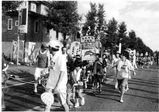
中之島第2「たんぼ子供会」のみこし