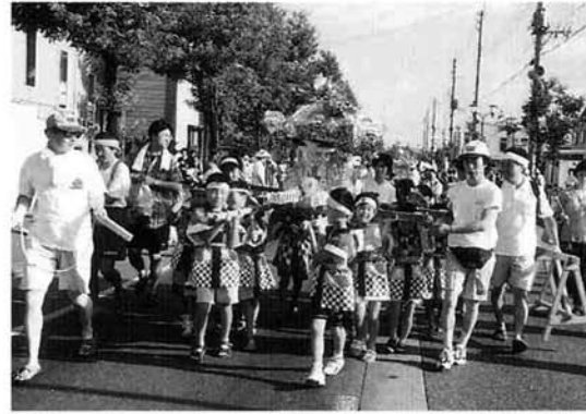
「五百刈あさひ子供会」「粕島子供会」の合同みこし