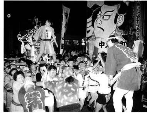
本部前でのみみあい