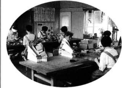
「虹の家」の作業風景

人間ドックを受け、その説明を聞きたいという方は、その結果をご持参の上、ご来場ください。