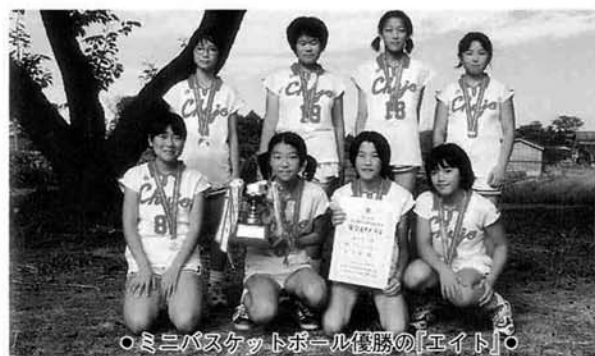
○ミニバスケットボール優勝の「エイト」

■野球 ◎優勝…上通ウイングス ○準優勝…2%阪神・巨人(中条) ・第3位…野球ぶ(中之島)、中野ヒットランズ ■ミニバスケットボール ◎優勝…エイト(中条) ○準優勝…上通松葉 ・3位…信条小Aチーム、Hi5(中野)