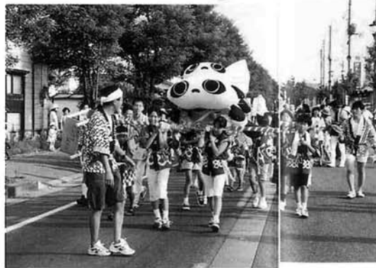
中野西「青空子供会」のみこし