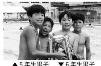
▲5年生男子 ▼6年生男子