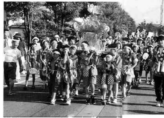
中通連合子供会のみこし