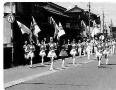
県警のカラーガーズ