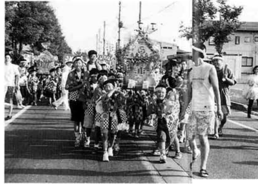
西所地区「笹舟会」のみこし