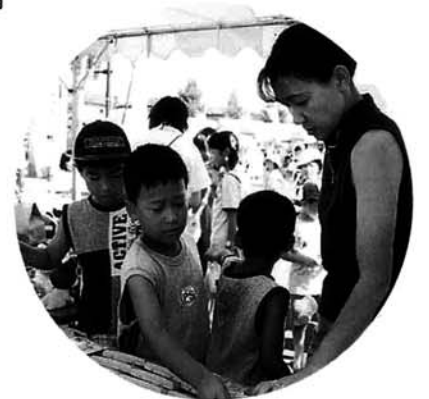
フリーマーケット