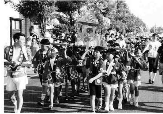
中之島第4「ひまわり子供会」中之島第6「竹の子子供会」猫興野「わかば子供会」の合同みこし