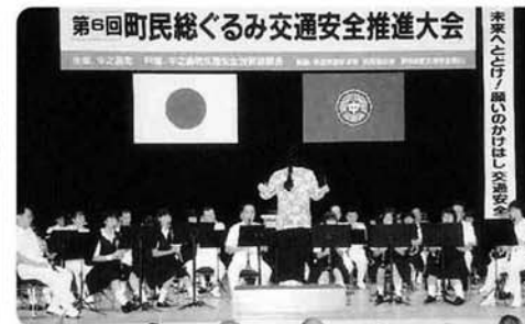
第6回町民総ぐるみ交通安全推進大会