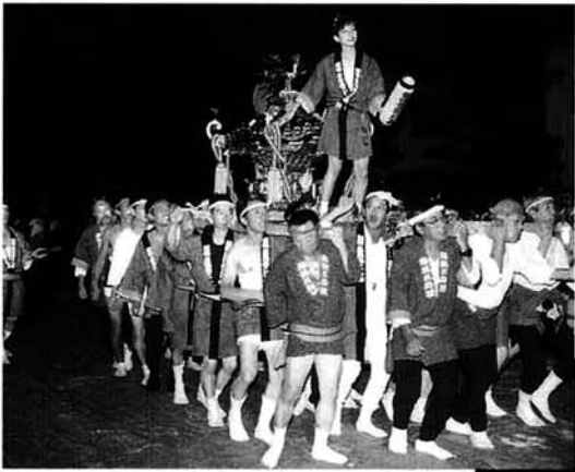
越後三島みこし会