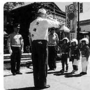
チビッコ白バイ隊の任命