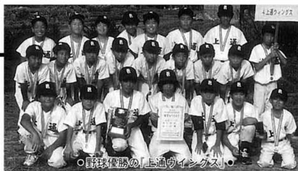
○野球優勝の「上通ウイングス」

地元住民や子供会、ボランティア団体など約140名の方々が参加。信濃川右岸の島田橋～真野代新田まで約8kmにわたり、ゴミや空き缶を拾い、2トラック2台ほど集まりました。