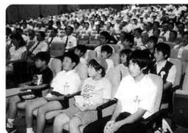
交通安全の作文と誓いの言葉を 読み上げた小・中学校のみなさん

推進大会では、小中学生が作文や誓いの言葉により、交通安全に対する心構えを披露。また、会場全体での大会宣言により、参加者全員がこれからも交通安全を推進するよう心を新たにしました。