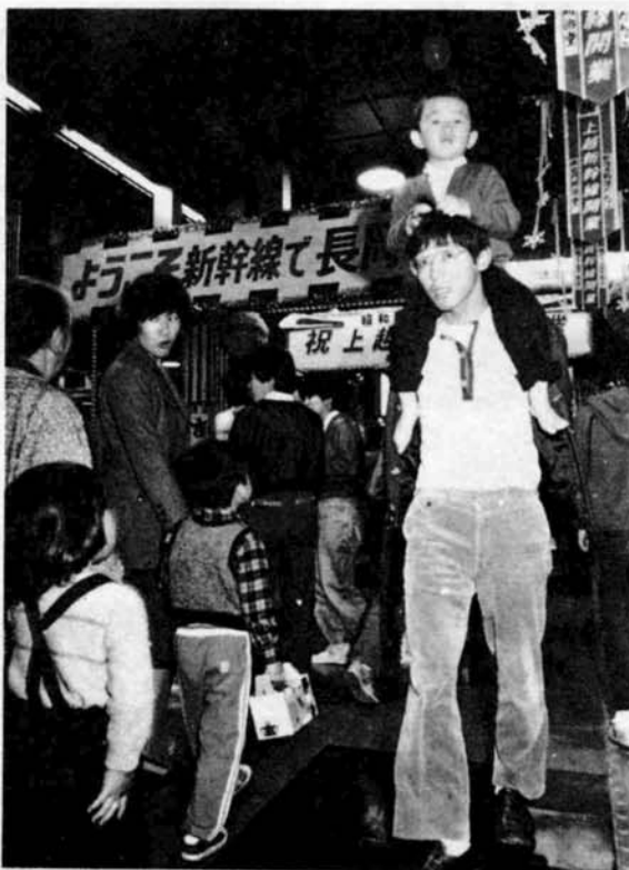
▲「パパ、早く早く！」新幹線は子供たちの人気の的。