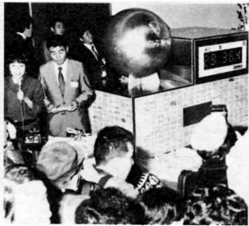
▲30年後の長岡はどんな姿に——1階コンコースでは、タイムカプセルを設置。