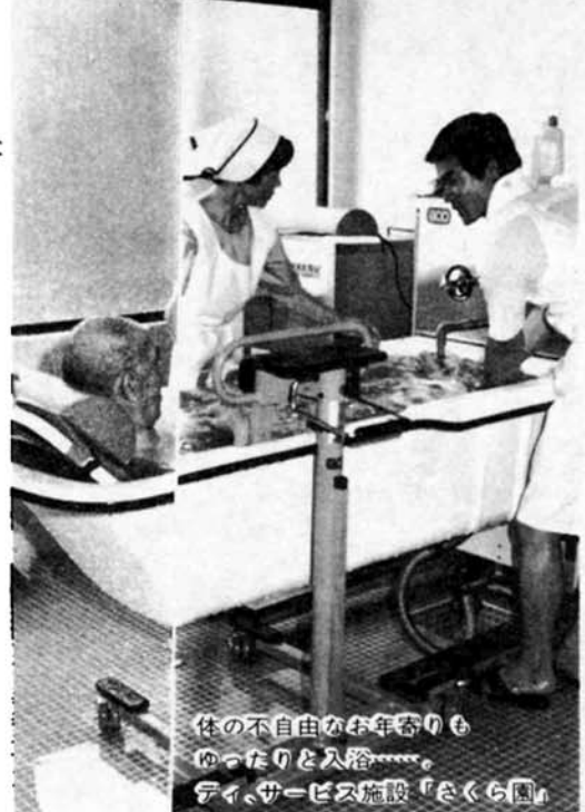
体の不自由なお年寄りもゆったりと入浴…。デイ・サービス施設「くらくら園」

市政に対する要望は、年々幅広く、しかも非常に細部にわたっています。そこで、がまんできるところは、がまんしていただいてもっと困っている人に、手厚い補助をするようにしています。 例えば、体の弱いお年寄りや寝たきりのお年寄りのために、デイ・サービス事業を新たに実施していますし、訪問看護指導事業、老人家庭奉仕員の増員など、いろいろと福祉の充実を図っています。 答1 老人クラブの補助金は、県の補助制度に基づいて、その指導に沿って行っています。今年から会員割がなくなったものですが、老人クラブの事情を県によく説明し、強く申し入れます。 会員四十四人以下の老人クラブへの補助は、ご要望にそえるよう努力したいと思えます。