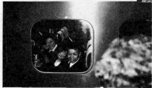
▲初乗りの新幹線出発