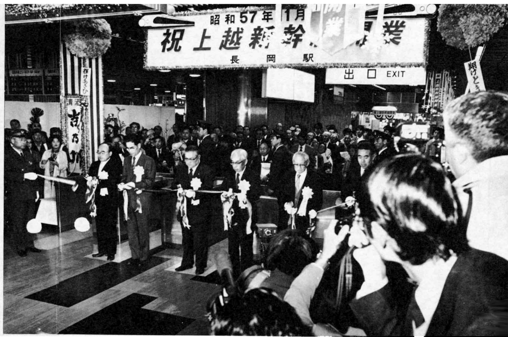
▲新幹線改札口に張られたテープにはさみが入ると、一斉にフラッシュが光り大きな拍手。この瞬間から長岡市は待望の新幹線時代に突入しました。