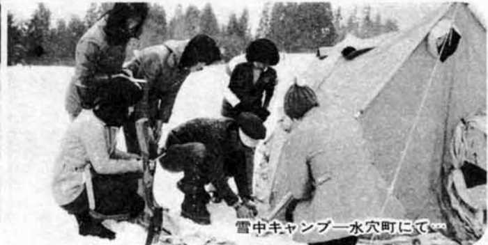
雪中キャンプ—水穴町にて—