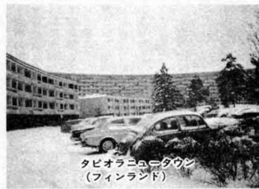
タピオラニュータウン (フィンランド)

式が生かされないものか、と思った。積雪三十センチ。地下鉄の駅の上に、大きな広場ができていた。日本なら一等地として、さしずめ商店街にでもなる所であろう。広場に対する考え方の相違を感じた。雪はなかった。 イーストキルブライド(イギリス) 長岡ニュータウンの開発上、参考になることが多い所である。地域振興整備公団では、調査員を長期派遣すると、雪はなかった。 レストン(アメリカ) ここを訪れる見学者は、年間七万七千人というから、大変な数である。長岡の場合も、見学者の受け入れ体制を今から考えておかなければならない、と思った。 ドンミルス(カナダ) 見た感じは長岡ニュータウンとよく似ている。雪は三十