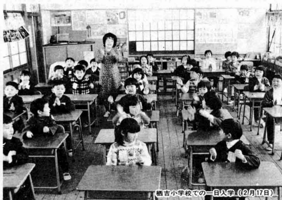
栖吉小学校での一日入学 (2月17日)