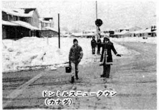
ドンミルスニュータウン (カナダ)

雪を克服する魔法の特効薬はなかった。けれども結論は極めて身近なところにあったというわけである。しかしそれにも増して大切なことは、市民ぐるみの協力である。どんなに雪に強い街が進んでも、除雪機械、技術が効果は上がらない。自分の家の前の雪は片づける、除雪の妨げになる駐車はしない、雪国の決まりを守り、みんなが協力する。この点だけは、雪に負けない住民の根強い姿勢として、今回私が視察してきた所の例に、学ばなければならぬと思ったのである。