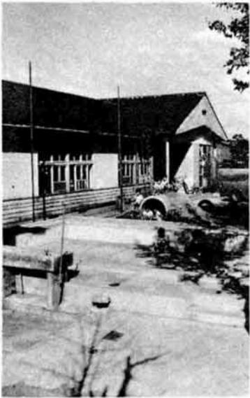
全部の保育所にちびっ子プールを……。