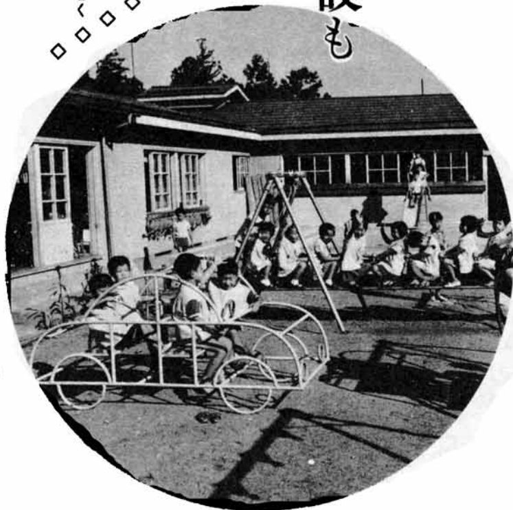
きょうも無心に遊ぶよい子たち……。そのすこやかな成長は明日の長岡の飛躍につながります。

また、いままですの保育所のなかつた中沢保育所、桂保育所、山本保育所、山通保育所、三和保育所の五つの保育所にそれぞれ幼児用のプールを備えます。 (昭和四十六年度) また、いままですの保育所のなかつた中沢保育所、桂保育所、山本保育所、山通保育所、三和保育所の五つの保育所にそれぞれ幼児用のプールを備えます。