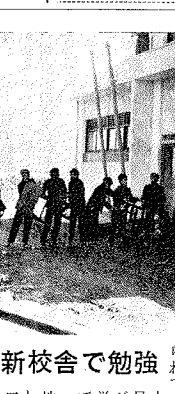
新築された市立小学校の校舎。

昭和三十九年度一般会計特別会計予算を主体に審議された三月定例市議会、三月十日に招集され、三月二十日の最終本会議をもって終了いたしました。新年度予算にスポットをあて、新しく予算の内容をまとめてみました。審議された他の議案の結果については、紙面の都合により次号でお知らせいたします。