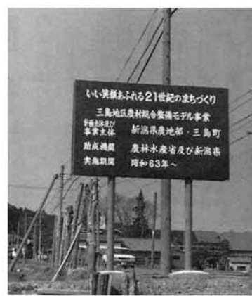
「い、美観あふれる21世紀のまちづくり」三島地区農村総合整備モデル事業 新潟県農地部・三島町 農林水産省及び新潟県 農林水産省及び新潟県 昭和63年

さらにはこの事業は、地域住民がもつエネルギーを環境改善センターの建設、農村地域の下水道といわれる農業集落排水施設整備の二つを柱に、農道整備、集落内道路の整備、農村公園施設整備等がこれら補完する事業の組み立てとなつてい事業初年度となる