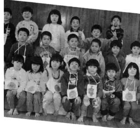
北部保育所の園児たち