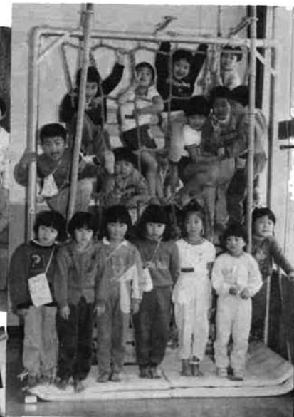
南部保育所の園児たち