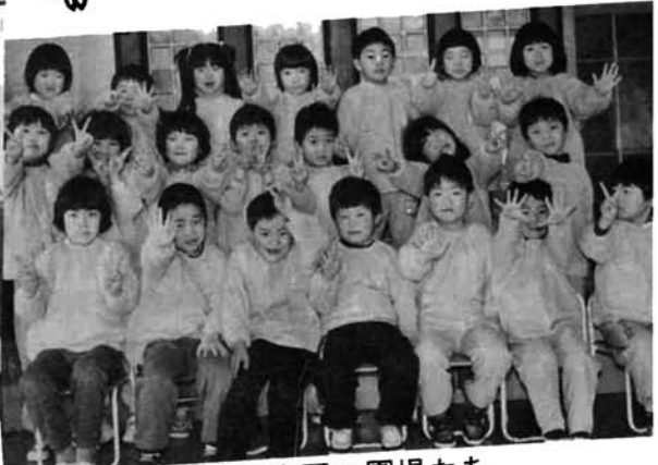
脇野町保育園の園児たち