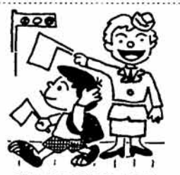
秋の全国交通安全運動 (9月21日～30日)