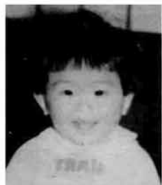
ボクが羽ばたく 大きな町に……