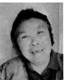
毎日が健やかで 楽しいです

率の高い事業の選択の予算内容に配慮されております。 当町の財政事情におきましては、現在の経済環境人口の推移の状況下では、急速な町税収入の伸びや地方交付税の増収は望めず、また国・県の負担補助金に頼りながらも、財政負担の見直し等厳しい情勢のなかで、いま計画している地域開発・庁舎建設等の諸政策の観点からも町債の発行を極力抑制しております。 しかし、落胆的・望観的行財政運営はゆるぎなく、創意工夫をもって長期展望に立った造地造成、企業誘致等を積極的に推進し人口増対策と収収の伸びを期しております。