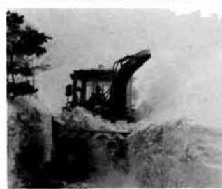
▲朝は午前3時から出動

最高積雪深(役場観測)一九五〇年、降雪日数(十二月十三日から)五十七日、積算降雪量六、五八〇、除雪機械延べ稼働時間九二三時間、除雪機械燃料費約九五万円(いすれも町直営分)。