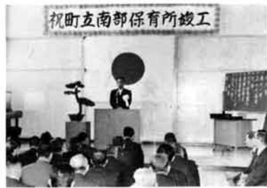
▲式辞を述べる町長

電話の移転・移設 できるだけ早く連絡を長岡電報電話局では、希望される日までに電話の取り付け工事を済ませるため、家屋の完成や、転居の日が決まり次第、一日も早く、工事の申し込みをされるよう、呼びかけています。 また、家屋の増改築の際にはあつて困らないよう、電話用の配管設備も忘れず、望んでいます。 電話の工事申し込みは、無料の☎32-0600です。