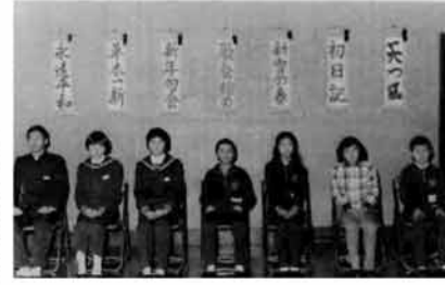
特選入賞の7人の皆さん

昭和56年2月15日 発行 新浜三島郡三島町役場 ☎(025842)代2221 昭和53年7月4日第3種郵便物認可 印刷 長岡市(株)中越タイプ社