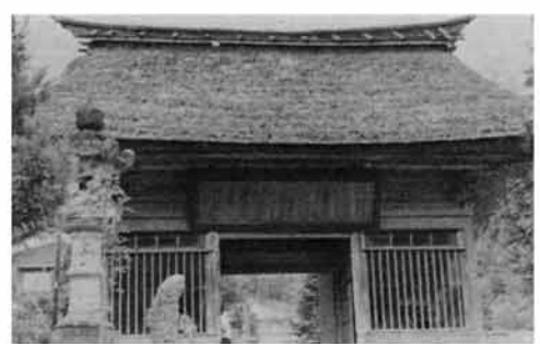
二百八十年前に建立された仁王門

六月二十日に開かれた教育委員会で、逆谷の寛益寺の仁王門など五件が、新たに町文化財に指定されました。