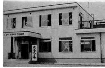
ガス事業の拠点となる新事務所

五月から工事が進められていたガス企業団の事務所と車庫が七月二十四日完成し、八月一日、午後二時から事務所二階会議室で竣工式が行われました。