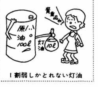
割弱しかとれない灯油

自動二輪車の事故死 多い、ノーヘル。自動二輪車(原付車含む)の交通事故が増えています。八月七日現在、県内ですでに十六人の人が死亡しています。この事故死のうち、大部分はヘルメットさえ着用していれば大切な命は取り留められたと、関係者は嘆いています。