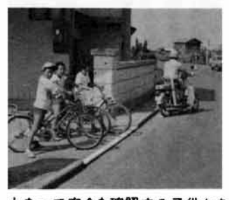
止まって安全を確認する子供たち

第二次世界大戦末期に撃沈された阿波丸から、遺骨や遺品の一部が中国側の手によって引き上げられ、肉親のもとに届いたニュースは、改めて戦争の悲劇を思い起こさせ、終ることのない「戦後」を痛感させました。