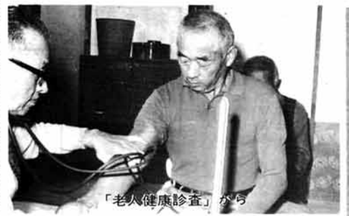
「老人健康診査」が行われている様子

ゼロ歳児、妊産婦、重度心身障害者、ねたきり老人及びひとりぐらし老人の医療費無料制度は、県が行う医療費助成制度で「県単四医療」と呼ばれています。残りの二つの制度は国の制度です。