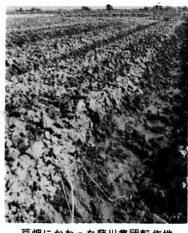
豆畑にかわった藤川集団転作地

赤ちゃんや、おとしりなどの医療費無料のための手続きを特集しました。現在、ゼロ歳児、妊産婦、重度心身障害者、ねたきり老人及びひとりぐらし老人の医療費無料制度は、県が行う医療費助成制度で「県単四医療」と呼ばれています。残りの二つの制度は国の制度です。