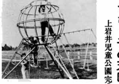
公園で遊ぶ子供たち

就職や婚姻によって故郷を離れた子供さんや兄弟、あるいは緑の方などに、希望によって町広報紙を毎月「ふるさとニュース」として、郵送する制度が、今年度から実施されます。 この郵送を希望される家族等の方は、次の要領でお申し込み下さい。 ◇申し込み要領 適宜な用紙に次の事項を記入し、一か月につき二十五円の郵送料の播種期までの間、大豆などがいま作付けされています。 周囲を水田に囲まれたほ場では水が大量に流入したり、しみ込みだりして他の作物への転作が事実上、不可能であるのに対し、用水を完全にコントロールできる。藤川団地は、他地区のモデルとして国の「総合普及実証」にも指定され、今後の転作を方向づけるものとして、その成果が期待されています。 町全体では、当初多くなると予想されていた農協管理転作が全体の三分の一に満たない十六ヘクタール程度にとどまり、麦、大豆、