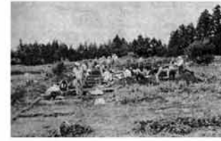
千石原遺跡の発掘作業

その後、ここを千石原遺跡と呼ぶことになり、町の文化財に指定されています。 石器、土器は長岡科学博物館に保存されていますが、町の資料館にも土器の破片や石鏃(やじり)石斧(おの)などが少しあります。これらは縄文時代人の生活を物語る用具で貴重なものです。 資料館としては、先人の残したものを一点でも多く集めて当時の人々の分布や生活状態を明らかにしていきたいと考えています。