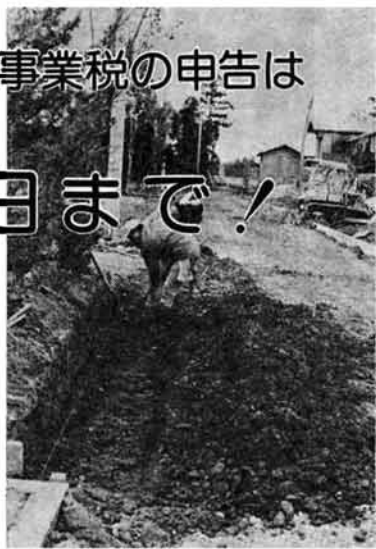
藤川神社線の改良工事

添付書類は早め用意を 所得税、県町民税、事業税の中 告をする時期が来ました。 例年のとおり今年も各地区に申 告のための相談会場が左の表の日 程で設けられます。間際になって 困らないよう早めに添付書類を用 意するなど「税の季節」にお備え 下さい。 現在の申告制度は、一年間に得