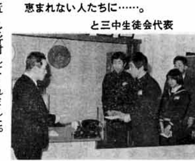
恵まれない人たちに……。と三中学生会代表

近くを寄附してくれました。また、同じく二十日町福祉係あてに二着のはんてんが匿名で届けられ、なかに「町のひとり暮らしのお年寄りに着てもらって下さい」と手紙が添えてありました。 町では、早速二人のお年寄りにこのはんてんを届けるなど、善意をお贈りしました。