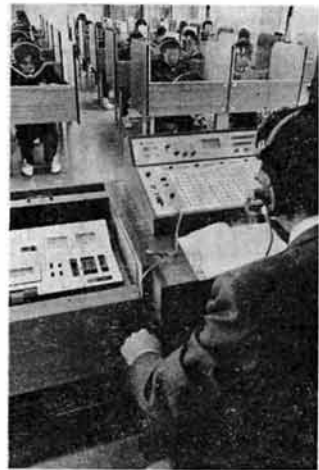
〇〇番さんわかりましたか。