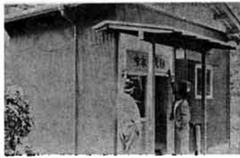
完成した中永公民館