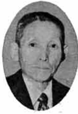
市長 西村 昌彦