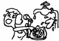
こんなことにならないように