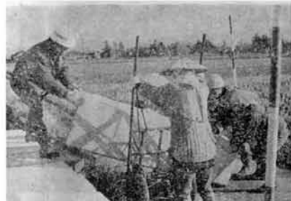
▲ 火葬場線改良工事