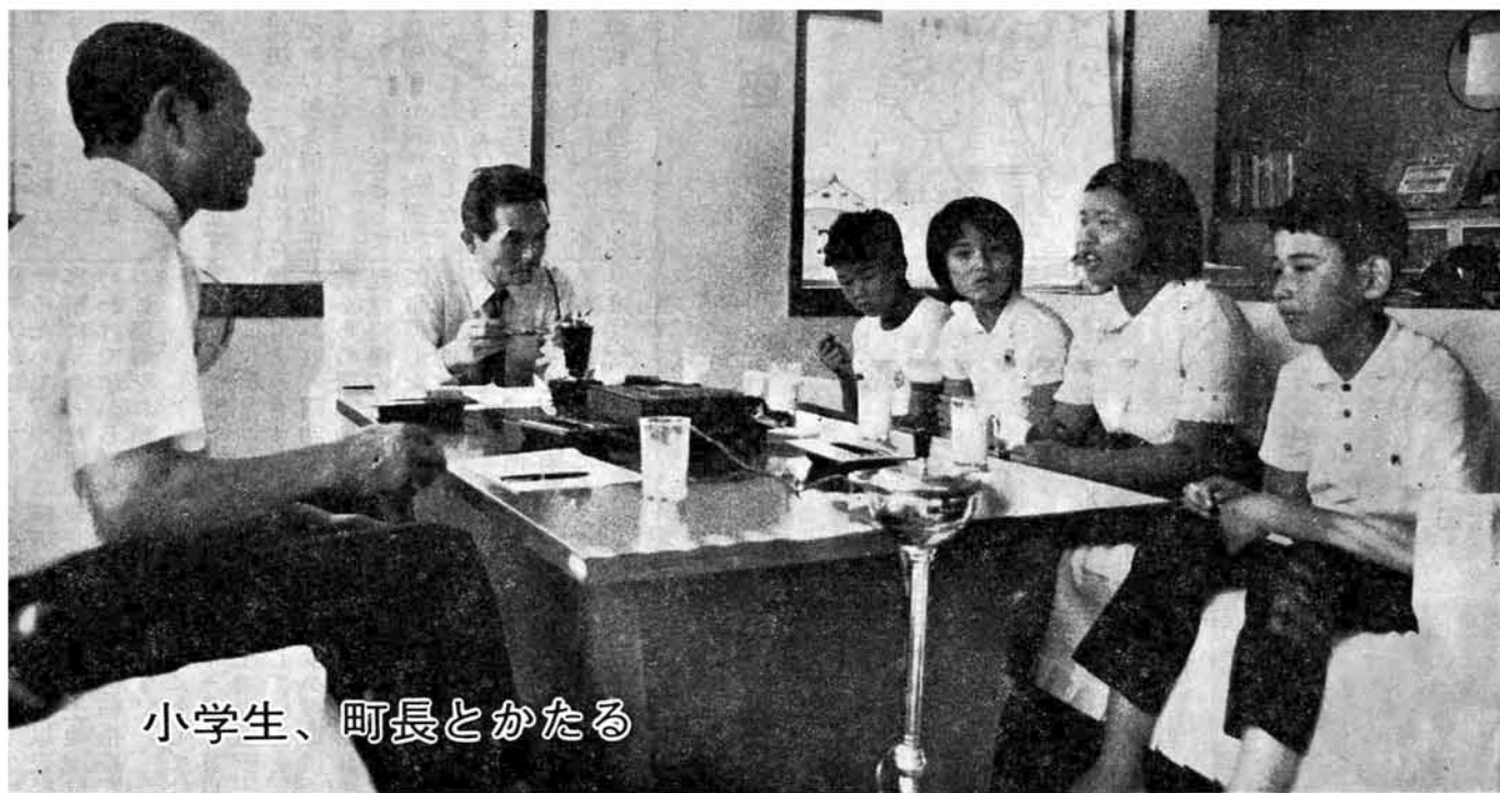
小学生、町長とかたる