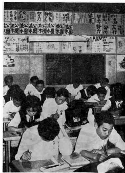
もうすこし 新しい中学校ができるぞ

六月二十六日から七月三日まで町議会第二回定例会が開かれました。三島中学校の建設用地購入費約二千六百万円の補正予算をはじめ、十三の議案についてそれぞれ、提案のとおり承認、認定、可決されました。 この補正予算の成立により、中学校の建設も、土地の確保にメドがついたわけで、いよいよ具体的な設計段階へと確実な一歩を踏み出しました。