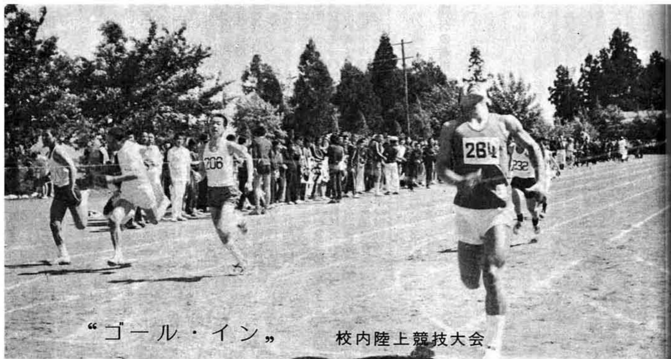
“ゴール・イン” 校内陸上競技大会

発行 昭和48年6月15日 新潟県三島町役場 TEL 0258-2222 局番 0258 (代) 2222 印刷 北越印刷株式会社 長岡市福住1丁目 TEL 030-