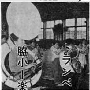
トランペット鼓隊練習 目吉小

日本には杉の大木名木がたくさんあります。現在、杉のチャンピオンは高知県長岡郡大豊町にある、目通り周囲十五び、高さ六十八びの「杉の大杉」で、国の天然記念物に指定されております。