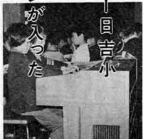
トランペット鼓隊練習 目吉小

日吉小学校のトランペット鼓隊は、六月十七日の運動会にそなえて毎日練習に一生けんめいです。