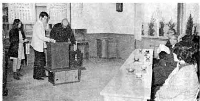
候補者の党の政見よく聞えた。私の信ずる人への投票に心も、はげれするものです。

先回(昭和四十四年十二月二十七日)の衆議院議員選挙と、最高裁判所裁判官の国民審査が、十二月十日朝七時から夕方六時まで、七投票所で、七投票所で行なわれ、この日は、まだ初雪を見ない師走の好天に恵まれ、投票率も先回より三・八割も高い九〇・三四割と好調な出足でした。