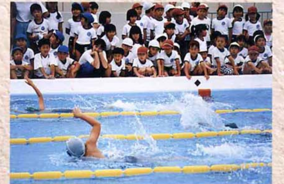
▲新プールで初泳ぎ (平成4年 脇野町小)