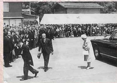
▲昭和天皇皇后両陛下が町体育館に立ち寄られる（昭和47年4月）