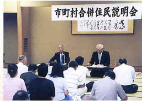
▲合併住民説明会 (平成16年8~9月)