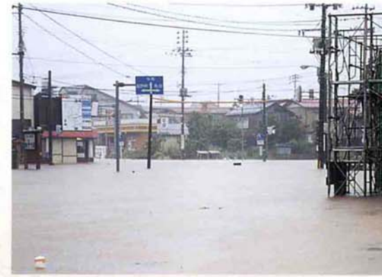
▲平成7年8・10豪雨 脇野町地内