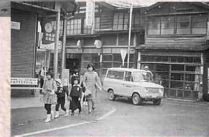
▲脇野町地内の風景（昭和43年）