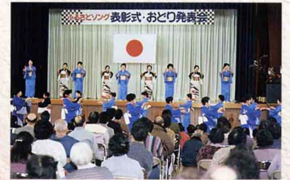
▲ふるさとソング「三島音頭」「三島慕情」発表会 (平成3年1月27日)