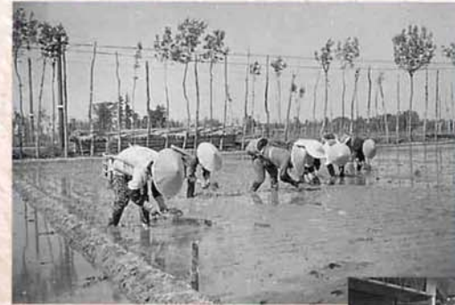
▲田園風景（昭和45年 大野）