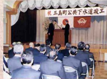
▲公共下水道竣工式 (平成15年3月12日)