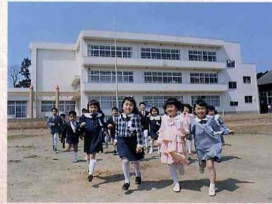
▲新しい日吉小学校校舎と新1年生 (平成6年)