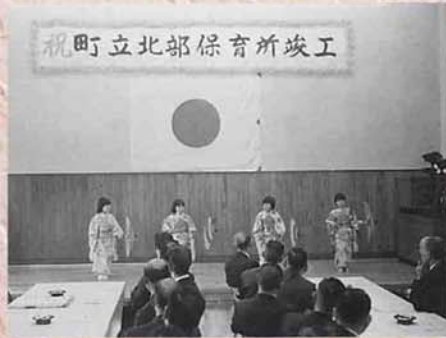
▲北部保育所竣工式（昭和53年4月）