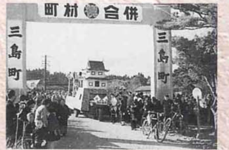
▲鳥越・七日市が三島町に編入合併（昭和31年9月30日）