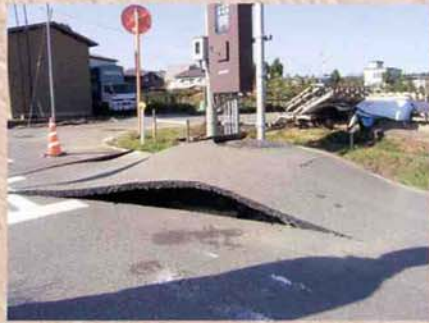
▲水害に続き大地震により甚大な被害。今後の復興が課題となる