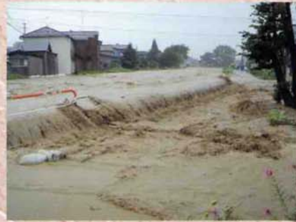
▲7・13水害 あふれる小木城川 (平成16年7月13日)