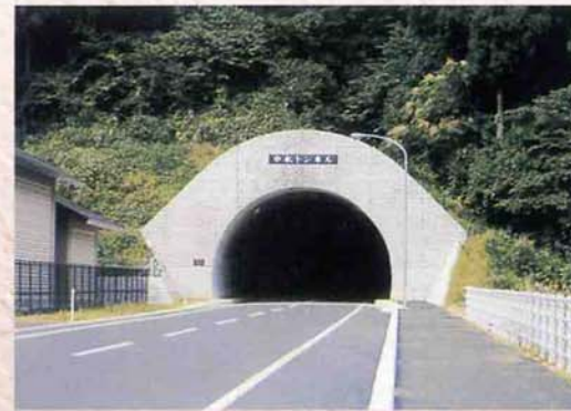
▲新中永トンネルが開通 (平成13年10月10日)