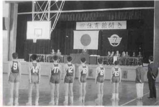
▲▶町体育館開きと当時の周辺（昭和44年）