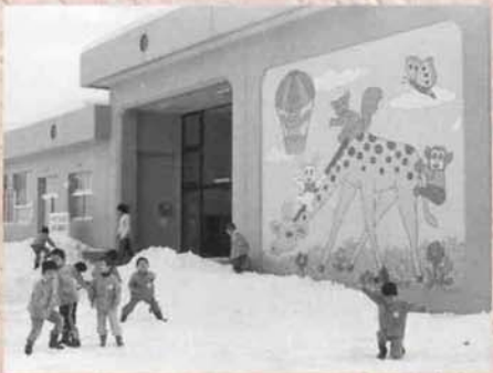
▲開所した南部保育所と園児たち（昭和56年）