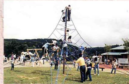
▲大杉公園がオープン (平成10年4月)