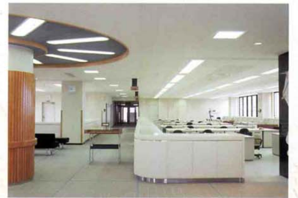
▲役場新庁舎竣工 (平成元年)