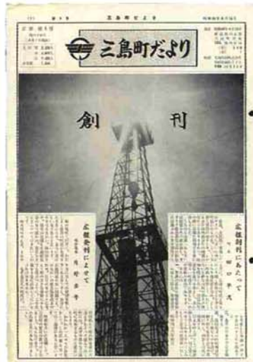
昭和43年4月発行の第1号

昭和43年からの37年間という長い歴史を持つ町の広報紙「広報みしま」は、今を強く感じました。合併後も新長岡市が、皆さんの手によっていつそう発展していくことを期待します。 最後に、「広報みしま」をはじめ、さまざまな場面でお世話になった町民の方々にお礼申し上げます。本当にありがとうございました。(燕)