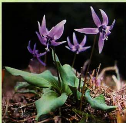
撮影日 一九九六年四月二十七日 場所 七日市 (写真・文 奈良正)

町の花として平成6年12月にハナミズキとともに選定された。町内山地に広く分布する。雪消えと同時に咲くので、春を待ちわびる雪国の人々に喜びを与えてくれる。また春の女神ギフチョウも好んで蜜を吸いに訪れる。 昔は球根から片栗粉を採ったというが、現在は馬鈴薯のでんぷんを商品名「片栗粉」として販売されていて名前だけが残る。 カタクリの種子に、蟻の好む物質「エライオソーム」が付属している、地中の巣まで運搬させるという繁殖の技には驚かされる。