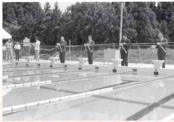
▲三島中学校プール竣工（昭和55年8月）

昭和30年3月31日、脇野町と大津村の一部が合併し、翌年9月30日に、日吉村のうち大字鳥越と七日市の編入により、今日の三島町が形成され、以来50年が経ちました。現在の三島町は、この地域を愛し、この地域とともに時代を生き抜いてきた皆さんの証そのものです。 三島町はこの3月31日をもって閉町し、4月1日から近隣5市町村の皆さんとともに新たな第一歩を踏み出します。新長岡市が皆さんの力で大きく発展することを期待します。