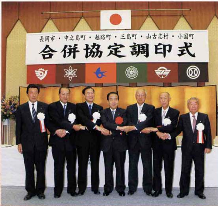
▲合併協定調印式 (平成16年9月9日)