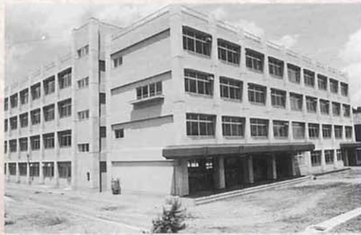
▲三島中学校竣工（昭和53年7月）