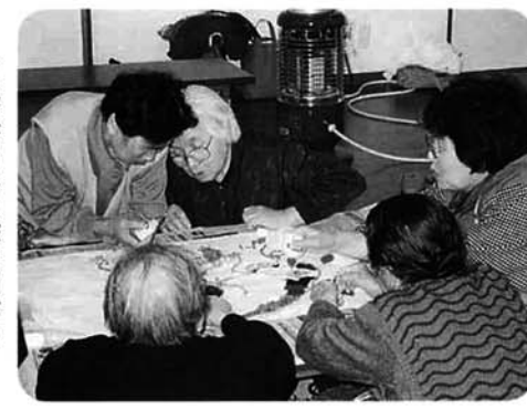
毛糸のはり絵を制作中