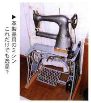
革製品用のミシン これだけでも逸品?

かばんや財布などの革製品を、自分の好きな形やデザインで作れたらどんなに素敵なことでしょうか。