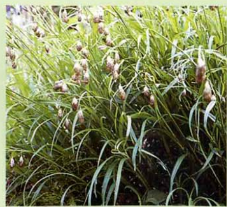
撮影日 一九九二年四月二六日 場所 鳥越字大畑 (写真・文 奈良正正)