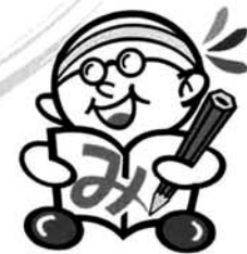
生涯学習マスコットキャラクター「みしまくん」