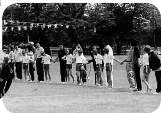
競技一つ一つに工夫が凝らされた日吉小学校の運動会

5月23日(日)、日吉・脇野町の両小学校で運動会が開催され、児童たちが元気いっぱい競技しました。 日吉小学校は創立110周年記念行事としての運動会となりました。