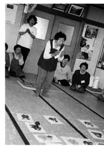
皆さんで楽しくレクリエーション

今年度からの試みとして、中永・蓮花寺の大正生まれの方全員に入会を勧めて、虚弱な高齢の方のみではなく、元気な