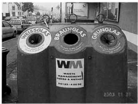
ビン回収用のコンテナ 市内のいたるところに設置されています。