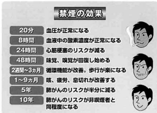
図1 禁煙を始めてから時間ごとに得られる効果 (米国肺協会資料より)