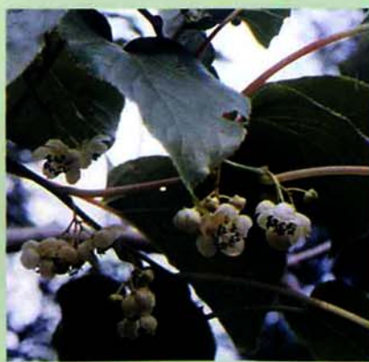
撮影日 一九九〇年六月八日 場所 鳥越字後谷 (写真・文 奈良場正二)

つるは丈夫で風雨に耐えるので徳島県「祖谷の蔓橋」は本種をシラクチヅルと称し用いるという。