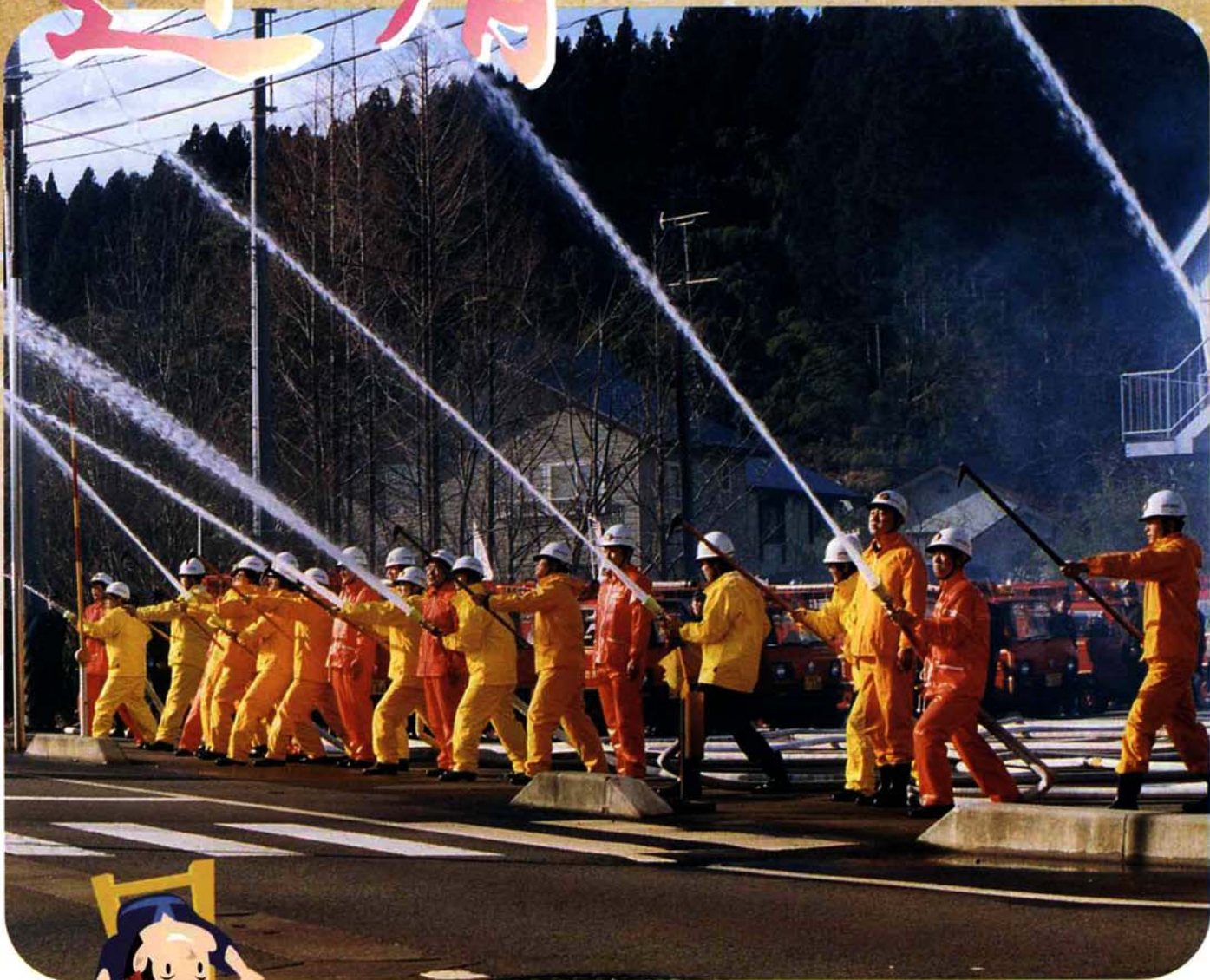
1月4日 消防団出初式