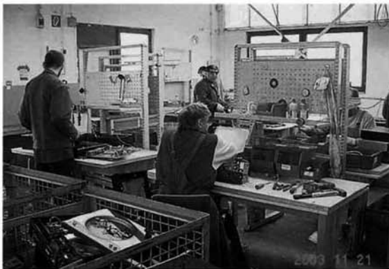
リサイクル作業の様子 単純な人海戦術の作業でした。(雇用対策のため、機械しかできないところは機械を使うが、それ以外はわざと人間がする。)

ゴミの回収については、家庭毎に排出する量によりコンテナの大きさを決め、処理料金(3人家族で5千円程度)を負担し、ピンの回収ボックスや衣類の回収ボックスが市内いたるところに設置され、リサイクルシステムが確立されていることに感心しました。ゴミ回収車はコンテナを持ち上げてひっくり返す装置があり、作業員が重いゴミを持ち上げて腰を痛め