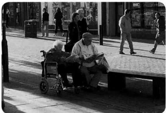
ショッピングモールの中の歩行者天国 老夫婦二人ゆったりとした時間のなかでショッピング

た光景は見られず、日本的にはちよつと寂しい気もしますが、それゆえ、車いすの老夫婦だけでも出かけられる。こうしたショッピングモビリティなるものも必要不可欠となるのだと思いました。