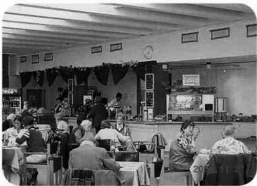
食堂での風景 とても施設の食堂とは思えません。

施設利用は月28000〜3900ユーロから、その内訳は介護保険・所得・年金・自治体扶助で構成されていますが、高齢者の数も年々増加傾向にあるため自治体負担が増えている現状であります。介護度は3段階で1が20%、2が45%、3が35%となっており、このホームの75%がアルツハイマーの状態であり、平均