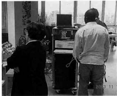
移動用マルチメディアスペース これにPCが13台接続される

ジョワンビル・ル・ポン市は、画像に関する職が360もある映画の街であったため、1995年、国が進めるITによる地域振興にすぐに飛び付き、デジタル雇用室を設置し、その後、ハイテク関連の施策を実施してきました。現在、3つのマルチメディアセンターを設置し、15歳〜25歳の若者向けにデジタルイメージのワー