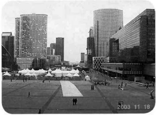
新凱旋門から見て、はるか前方に凱旋門が直線で見える

ショッピングモビリティとは、障害者やお年寄りなど体の不自由な方々でも、電動カート等を活用して自由に出歩き、買い物を楽しむことのできるサービスを提供するもので、英国では、二十年ほど前