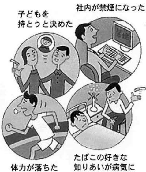
図2 禁煙を始めるきっかけ

禁煙を成功させるため 逃がさず、周りに禁煙を には、その始め方が大切 「宣言」しましょう。 禁煙後は、ストレスを ためず上手に解消する ことも大切です。 たばこを吸いたくなっ た時には、深呼吸をする、 水を飲む、ガムを噛む、 軽い運動をすることなど が効果的といわれています。