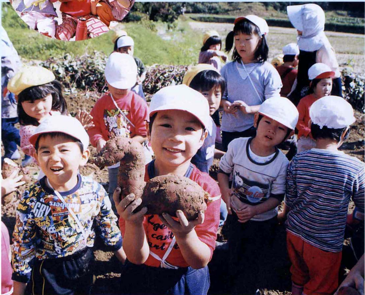
北部保育所のいも掘り 10月10日(金)青空の下、上条の畑でいもほりが行われました。子どもたちは掘り当てたいもの大きさに興奮していました。