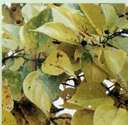
撮影日 一九九三年十一月八日 場所 蓮花寺 (写真・文 奈良場正一)

写真は果実が熟すころのもの。径約、六㎞、紅褐色。食べられる。甘い、水分がなく粉っぽい。