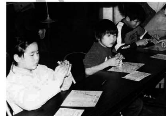
ひみつ箱のコーナー