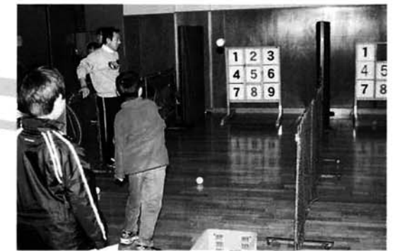
ストラックアウトのコーナー