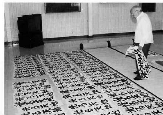
4時間以上もかけて慎重に審査