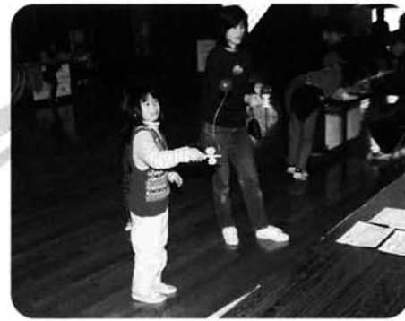
けん玉のコーナー