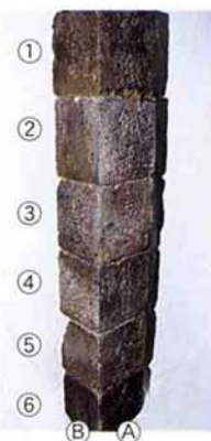
▲切石型六地蔵の全体の姿 正面(ア)と左側面(B)の写真

私たちが普段目にする石佛姿の六地蔵と違って、切石型のものが中条にある。一片が高さ二十一cm、幅二〇・五cm、奥行十七・五cm、重さ十五kgで六個を積み重ね、全体で一・二六mの高さになる。