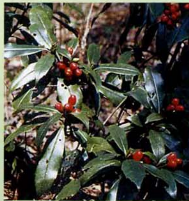
撮影日 一九九〇年四月一日 場所 鳥越字原 (写真・文 奈良場正一)

町内山地でごく普通に見られる。方言がいろいろあるように、馴染み深い植物で、赤い果実は生花の花材にしたり、昔の子どもはままごと遊びに用いた。花は春咲く。雌株の果実は初冬から色づきはじめ、翌年の春には真っ赤になる。