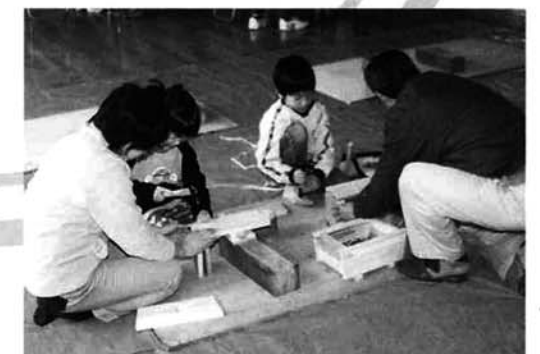
プラントーづくりのコーナー