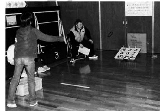
輪投げのコーナー