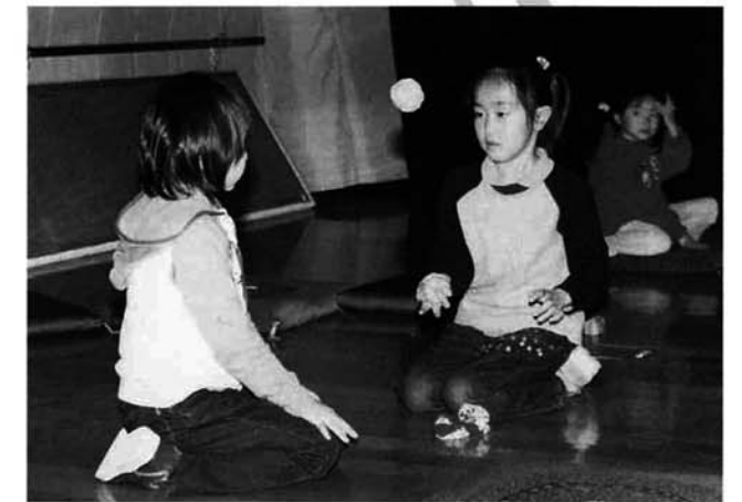
お手玉のコーナー