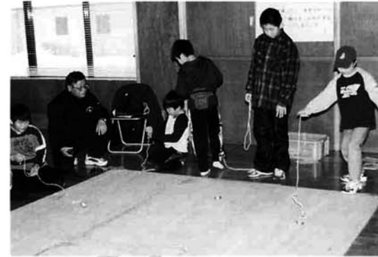
こま回しのコーナー

1月25日(土)の午前中、中央会館のホールで「遊びの祭典パート2」が開かれました。 いろいろな遊びや製作体験のコーナーを11コーナー設置し、小学生と家族の皆さんが自由に回って、昔の遊びやプラントーづくりなどにチャレンジしました。 多くのコーナーをまんべんなく回っていろいろな遊びを体験していた参加者、一つか二つのコーナーに集中してよい記録を出そうと頑張っていた参加者など、思い思いに楽しむ姿が見られました。 昨年度の最高記録を超える好記録がたくさん生まれました。