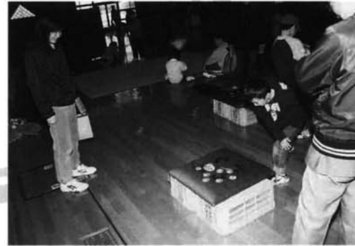
メンコのコーナー