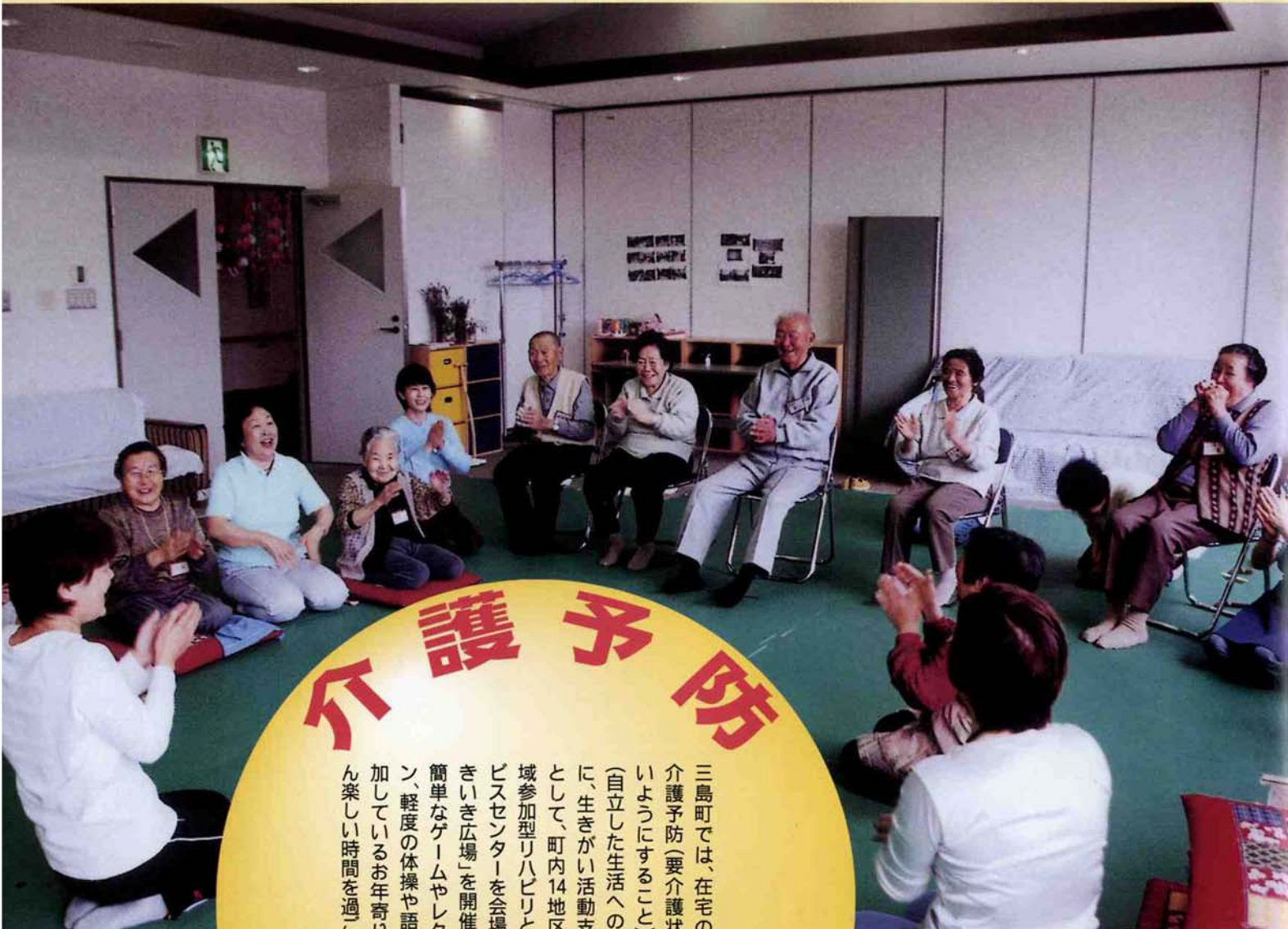
▲4月23日、町デイサービスセンターにて、「いきいき広場」

介護予防 いきいき活動支援 三島町では、在宅の高齢者への介護予防(要介護状態にならないようにすること)と生活支援(自立した生活への支援)を目的に、生きがい活動支援通所事業として、町内14地区12会場地域参加型リハビリと、町デイサービスセンターを会場に月2回「いきいき広場」を開催しています。簡単なゲームやレクリエーション、軽度の体操や話らいなど、参加しているお年寄りたちは皆さん楽しい時間を過ごしています。