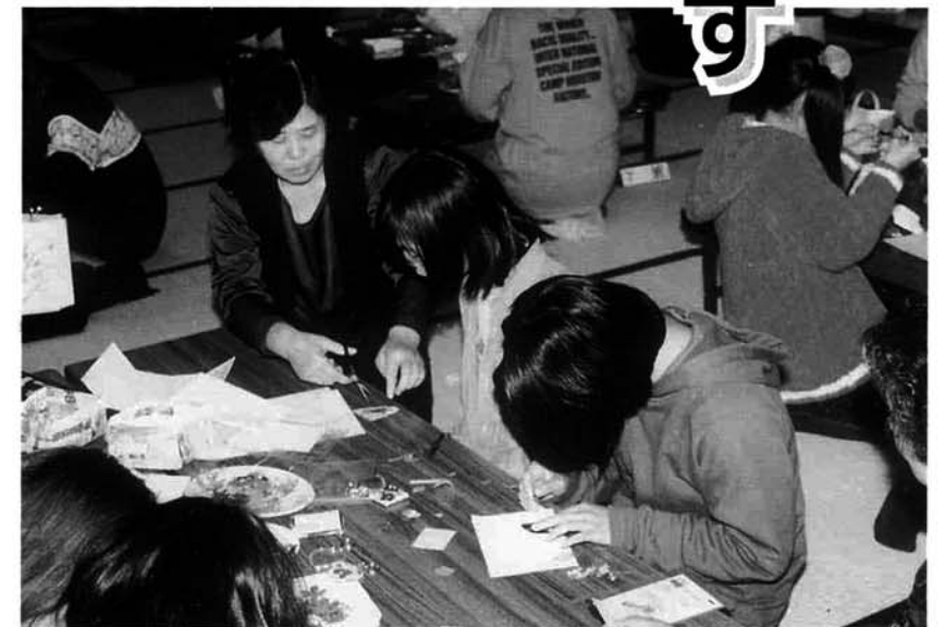
「押し花づくり」の時には、町の押し花サークルの皆さんから教えていただきました。

など、いろいろな分野で知識・経験・特技をもち、それを他の人にも伝えようという熱意のある方なら、どなたでも大歓迎です。