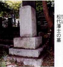
▲与板郡野神社境内にある松代藩士の墓