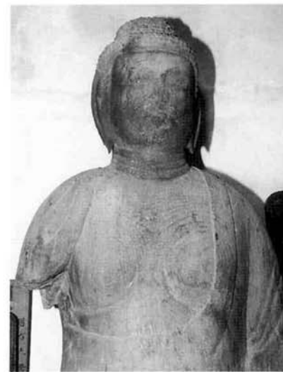
↑ 木造釈迦如来坐像

寺の縁起によれば真言宗法華寺の開創は奈良時代(八世紀)と云う。元々は蓮華部寺と称し、集落の西裏山の板ヶ沢、通称寺山にあり現在も跡地と推測される遺構や観音屋敷、本堂跡などの地名も残っている。平安時代弘仁年間(九世紀前半)に現在地に移り法華寺となった。その際法相宗から真言宗に転宗したと伝わっている。坐像は緻密で耐朽力のある桂材の一木造りで像高は94cmである。ふくよかな顔立ち、撫肩の穏やかな姿などから平安時代後期(十一〜十二世紀)の特色があると鑑定されている。一方立像もほぼ同じ高さの桂材一木造りで