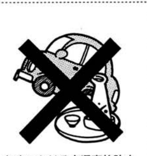
年末における交通事故防止

与板警察署鳥越駐在所の改築工事が終わり、業務が始まっています。 新しい駐在所は、旧日吉支所跡地に建てられ、これまでより広い、ゆったりとした敷地に、木造平屋建てで建てられています。 駐在所の堅いイメージを払拭し、地域住民により親しまれるよう、乳白色の外観となっています。