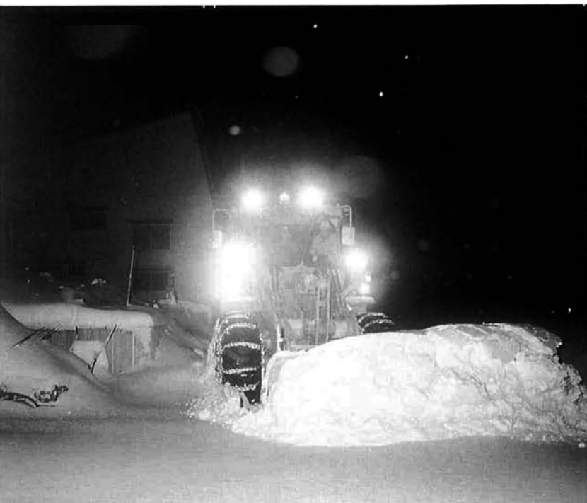
通勤・通学にまにあわせるため、早期耳障りな除雪車の騒音が聞こえてくることもありますが、ご理解ください。

冬期間の道路交通を確保するため、道路除雪が行われます。安全で、効率的に除雪が出来るように、また、その効果が充分生かされるように、みなさまのご協力をお願いします。