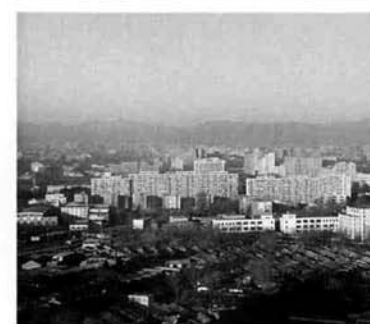
マンションと胡同(フートン)が混在する北京市街

▼早いもので、平成7年もあとわずかとなりました。震災やサリン事件など、何かと暗い出来事が多い年でした。が、三島町は数々の合併四十周年記念事業で、大いに盛り上がった年ではなかったでしょうか。▼先日、中国(北京)を旅する機会がありました。首都空港から一直線に市内に延びる高速道路、林立する高層ビル群は、ここ一二年ほどの間にできたもので、中国の「改革・開放」のめざましさを象徴しています。大通りの車と自転車の波、繁華街の人の群れ。その喧騒(けんそう)にも圧倒されました。マンションが建ち始めた北京で、今なお大通りや繁華街からほんの少し入った「胡同」で暮らす市民もいます。胡同はおよそ七百年前の明の時代から続くもので、「フートン」と発音します。もともとモンゴル語で「水のあるところ」という意味で、生活の場を指しています。胡同は古い灰色の外壁に囲まれ、中央に中庭を持ち、これを東西南北に囲む形で、長方形の建物が配されています。路地に対して門があり、観音開きの扉が取り付けられています。胡同はお世辞にもきれいとは言えません。しかし、よく見ると門扉にうっすらと赤や緑が残っていて、かつては極彩色のものであったことがしのばれ、漢詩の文字が浮いて出ているのを見ることもあります。社会基盤の整備が進んでいる北京でこれを見るとき、この地の長い歴史と文化の薫りが感じられます。