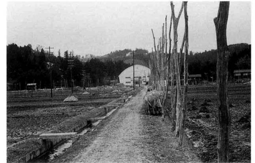
昭和45年の町体育館前