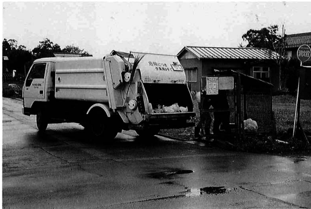
ごみ収集場所は共同で利用管理する場所です。みんなできれいにし、気持ちよく利用しましょう。