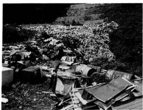
逆谷最終処分場—文化的生活の末路

逆谷最終処分場は、燃えないごみの埋立地です。搬入される場合は、事前に住民課保健衛生係へ手続きをお願いします。