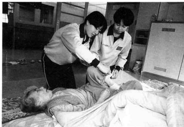
入居しているおばあちゃんにせがまれ、足をふいてあげる女子生徒