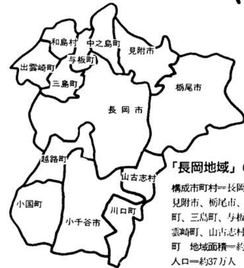
「長岡地域」の構成市町村 構成市町村＝長岡市、小千谷市、見附市、栃尾市、中之島町、越路町、三島町、与板町、和島村、出雲崎町、山古志村、川口町、小国町 地域面積＝約1,110km 2 合計人口＝約37万人

うまく結び付けよう、これらの事業が進むと、高速交通網が整備された長岡地域は、拠点性を一層高めることができるのです。 今後は、県知事の正式な指定を受け、関係市町村と十分協議をしながら、三月末までに具体的な計画を策定します。 町では、各市町村との連携のもとで、三島町の主体性と役割をしっかりと反映する計画づくりを進めることにしています。