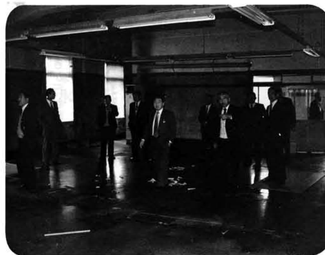
▲すっかり整理された2階を見て廻る

昨年六月の新役場庁舎の完成に伴い、旧庁舎が取り壊されました。これに先立ち、二月二十六日には「旧庁舎とお別れ会」が開かれ、集まった議会関係者、区長さんらは旧庁舎内を視察し、互いに想い出を語りあいながら名残りを惜しんでいました。 旧役場庁舎は鉄筋コンクリート造りの建物がまだ、珍しかった大正十五年に建設。その後六十有余年の長期にわたり、町のシンボル、行政の中枢としての役割を果たしてきました。 旧庁舎については「歴史のある建物でもあり、保存策を講じて他に活用すべきでは……。」という意見もありましたが、雨漏りなどの補修や維持管理にかなりの出費が見込まれること、また小木城川堤防のかさあげにより、道路よりも旧庁舎が低い状態のため、このままでは活用しにくいことから、思いきって取り壊し、跡地約二千平方メートルを整地することとなりました。