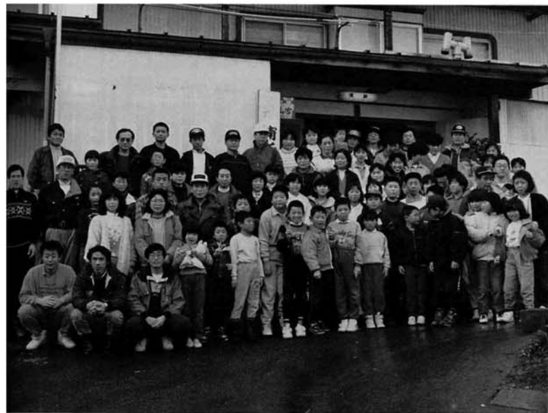
宿舎前で記念撮影

三月三、四日、北魚沼郡守門村須原スキー場で、「町民親子スキーのつどい」が開催されました。時折、小雨が混じるあいにくの天候となりましたが、スキー教室に参加して、メキメキと上達した人あり、ゲレンデに自由自在のシュプールを描いている人ありで、参加者全員思いきってスキーを楽しみました。