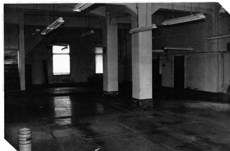
▼経費の無駄をなくすため、「福祉センター」も一緒に取り壊されました。