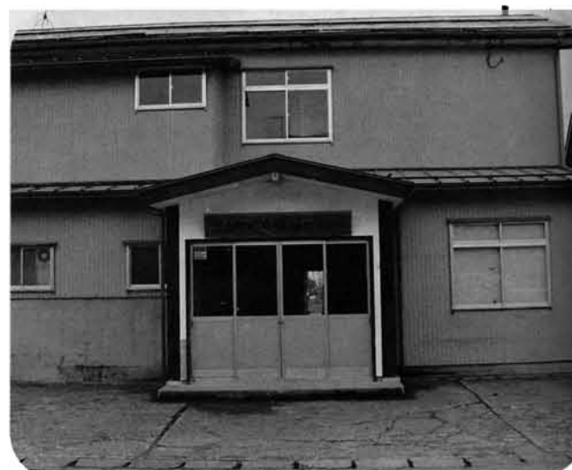
▲多くの会合、文化講座が開かれた分館