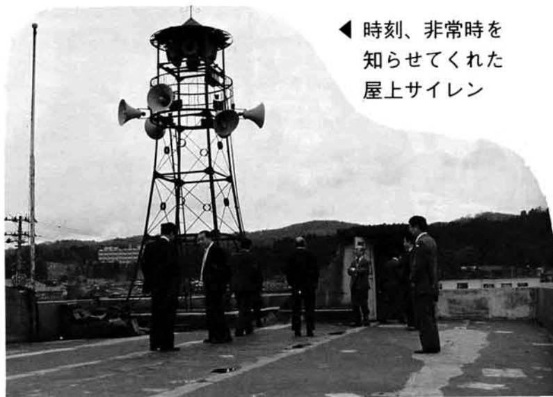
◀時刻、非常時を知らせてくれた屋上サイレン

町では、平成三年度の早い時期でのオープンを目指して積極的に作業を進めています。オープン後はこれから設立される公益法人が管理運営にあたることとなります。