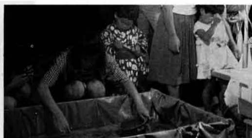
私もやってみようかな