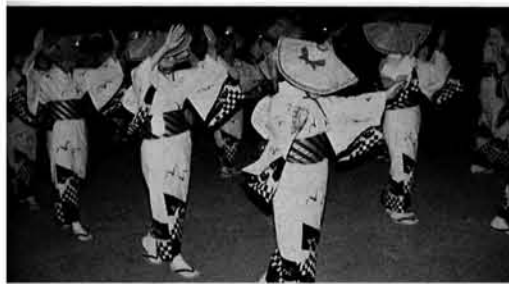
総勢250名が参加した民謡ながし