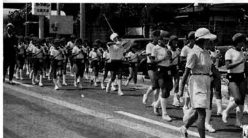
うまく吹けているかな？