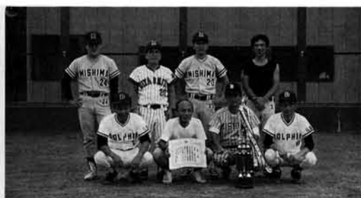
優勝した商店会チーム