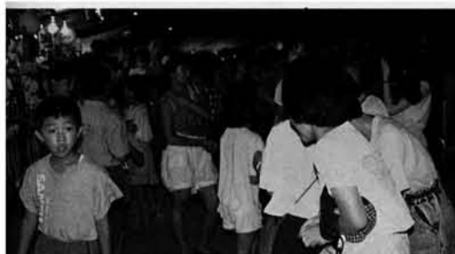
多くの人出でにぎわったまつり広場