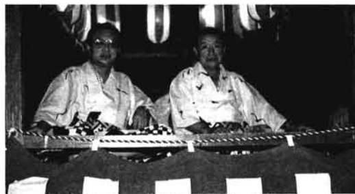
町長さん、議長さんもご満悦