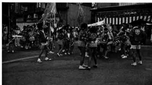
「ワッショイ、ワッショイ」暑さにまけるな