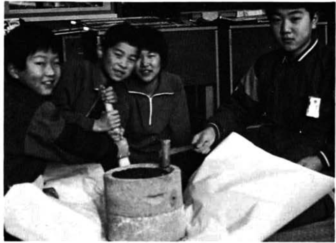
石うすをひく谷っ子（提供 東谷小）

四方を山に囲まれ、小高い所に建つ全校児童四十二人の東谷小学校には、「谷っ子活動」と称する児童会活動がある。花だんや菜園の世話、授業以外の行事は谷っ子活動で運営する。