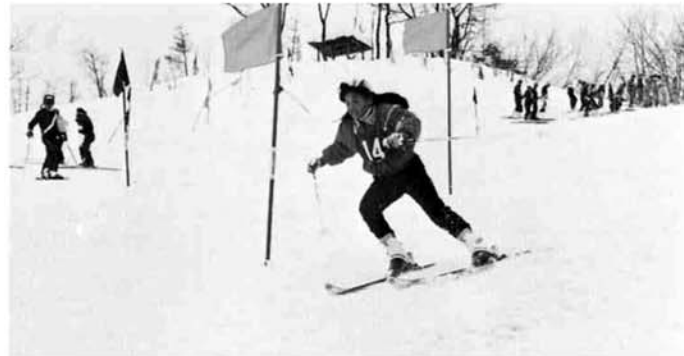
小学生女子の大回転

好天に恵まれた2月14日、第27回目を迎えた町民スキー大会が開催されました。今大会には各種目に287名が参加、昨年を70名も上回る盛大な大会になりました。また、大会の前日スキー場での前夜祭には、約30名のスキーヤーによるタイムツ滑降が行われました。