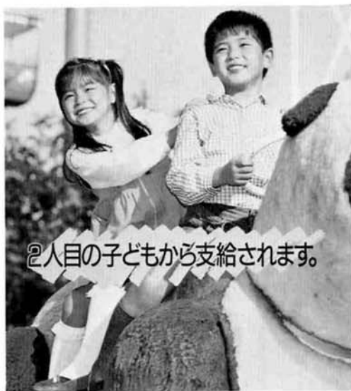
2人目の子どもから支給されます。