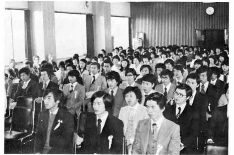
真剣なまなざしが