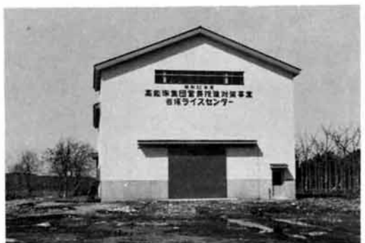
岩塚農業協同組合と岩塚水稻生産組合が事業主体となり、二十一

戸の農家を対象に「高効率集団営農対策事業」の一環として、飯塚字原の下に岩塚ライスセンターがこのほど完成し、四月八日に竣工式が行なわれました。