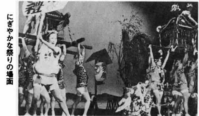
にぎやかな祭りの場面

わたしが、特に感動したところは、学校に行かないで子どもを育てた少女をめぐってみんなの心が一つになっていく友情の場面