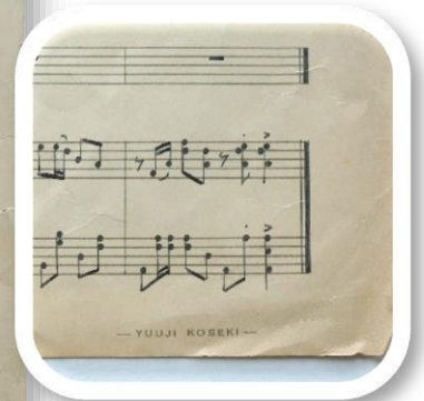
▲ 主旋律が書かれた楽譜 (部分) 専用の五線紙が使用されています