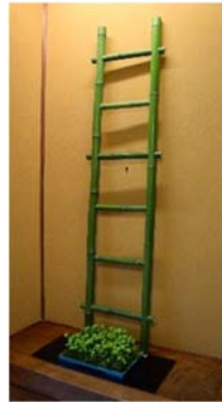
▲長岡藩ゆかりの「五間梯子」をイメージして、ゴールまでの架け橋となるよう願って待合にかけられていました。

長岡市茶道文化協会主催の開府400年記事事業の「長岡市民リレー大茶会」が、越路地域の松籟閣をスタート会場に開催されました。10月の長岡会場まで市内11地域をリレーでつなぎます。(4月15日)