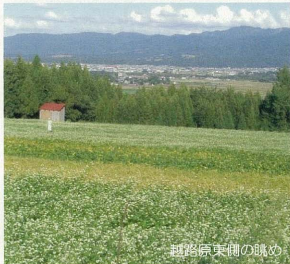
越路原東側の眺め

越路原は「そばの花」や「実った稲」などでとてもカラフルです。晴れた日の夕焼けも本当にきれいです。そばの実は10月に収穫され11月3日（木・祝）には「越路新そばまつり」も開催予定です。