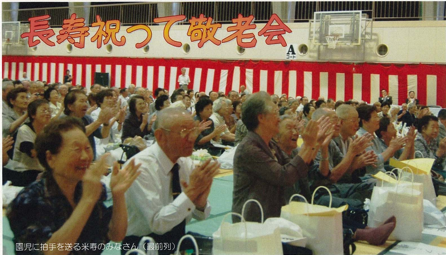
園児に拍手を送る米寿のみなさん（最前列）

越路体育館で行われた「敬老会」には、75歳以上の対象者2,351人（男性858人 女性1,493人）の内、774人がご参加いただきました。来賓者の話に、誰一人私語をすることなく、黙って耳を傾けるお年寄りの姿に本来の「日本人の姿」を教えてくださいました。米寿を迎える方に「今までで一番の思い出は？」と質問すると、「結婚して3年しか一緒にいれず、戦死してしまったお父さん（旦那）です。幸せでしたよ。」また、「戦争に行ったこと。同級生が何人も死んでしまった。」と無念な思いを語ってくださいました。若くして亡くなってしまった方々の分も、これからもお元気で、楽しんでお過ごしください。（9月17日）