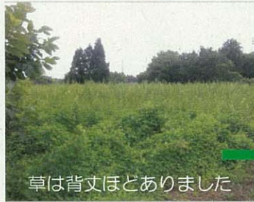
草は背丈ほどありました