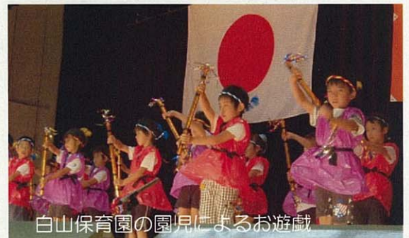
白山保育園の園児によるお遊戯

越路体育館で行われた「敬老会」には、75歳以上の対象者2,351人（男性858人 女性1,493人）の内、774人がご参加いただきました。来賓者の話に、誰一人私語をすることなく、黙って耳を傾けるお年寄りの姿に本来の「日本人の姿」を教えてくださいました。米寿を迎える方に「今までで一番の思い出は？」と質問すると、「結婚して3年しか一緒にいれず、戦死してしまったお父さん（旦那）です。幸せでしたよ。」また、「戦争に行ったこと。同級生が何人も死んでしまった。」と無念な思いを語ってくださいました。若くして亡くなってしまった方々の分も、これからもお元気で、楽しんでお過ごしください。（9月17日）