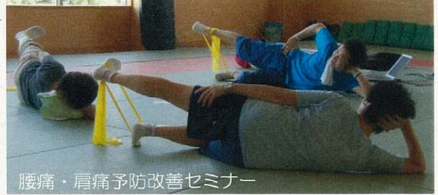
腰痛・肩痛予防改善セミナー