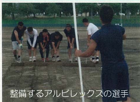
整備するアルビレックスの選手

新潟・福島豪雨で冠水した越路河川公園野球場の復旧作業がアルビレックスB・Cの選手達の協力で行われました(8月1日)