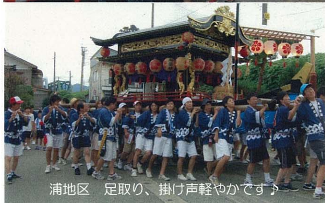
浦地区 足取り、掛け声軽やかです♪