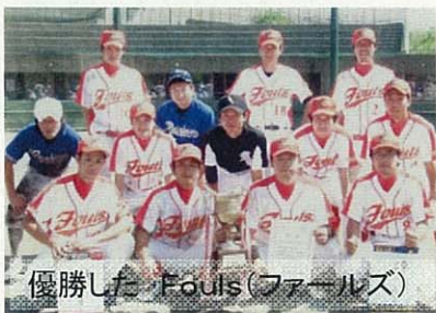
優勝した Fouls(ファールズ)

水害から復旧した越路河川公園野球場などで、野球大会が開催されました。暑い中、14チームが出場し、Fouls(ファールズ)が見事優勝しました。(8月14日)