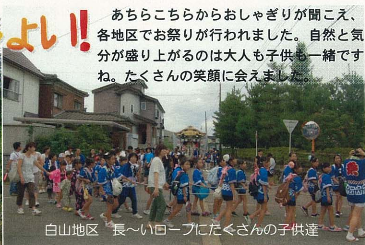
白山地区 長〜いローブにたくさんの子供達