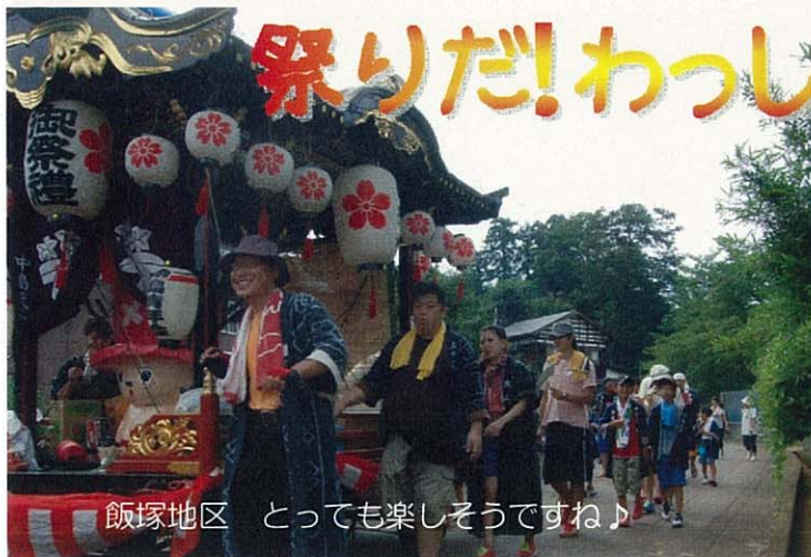
飯塚地区 とても楽しそうですね♪

あちらこちらからおしゃぎりが聞こえ、各地区でお祭りが行われました。自然と気分が盛り上がるのは大人も子供も一緒ですね。たくさんの笑顔に会えました。