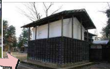
< 井籠蔵 修復後 >