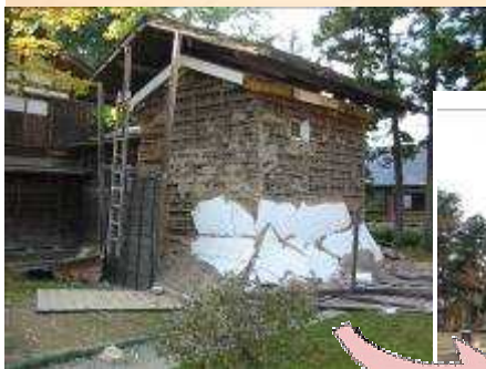
< 井籠蔵 修復前 >