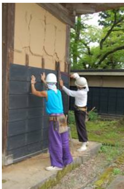
表門の壁にも亀裂が…