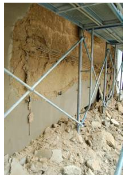
新蔵の壁もはがれ落ちました。