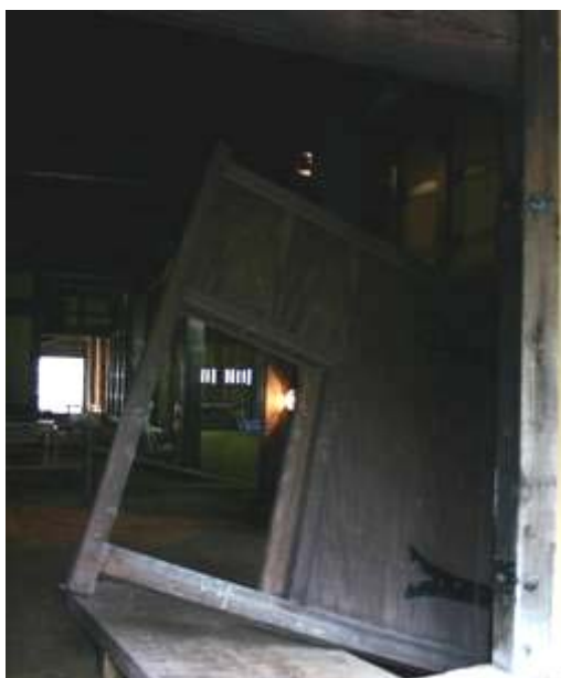
外れた大戸が揺れの大きさを物語る