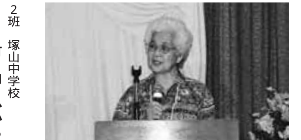
戦争体験を語ってくれたシスターアダさん