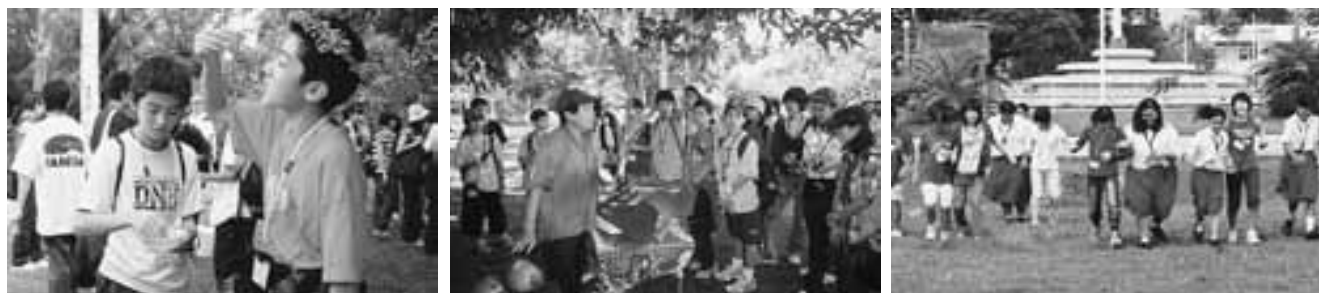
はじめて食べる「ヤシの実」の味は? サイパン植物園で熱帯の世界を満喫 スポーツ交流で2人3脚に挑戦