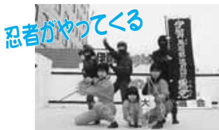
伊賀流忍者黒党(クロンド)ショー (14:00~16:30~の2回)