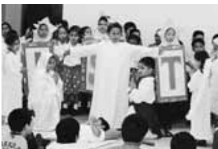
交流会でクリスマスショーを披露するマウントカーメル学校の皆さん