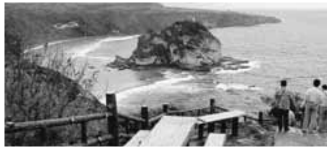
バード・アイランド