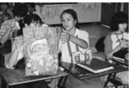
何が入っているか楽しみ！プレゼント交換