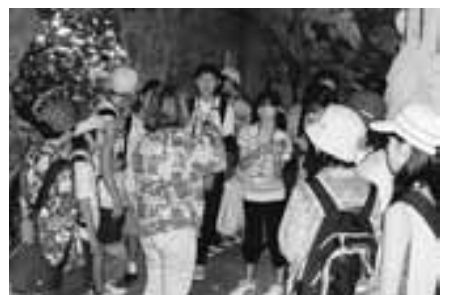
激戦地だった戦跡 ラスト・コマンド・ポストを訪れて

を少しひろうしてもらいました。パートナーとは話しておもしろいし、なにより私の英語が現地の人に聞いてその返事を返してもらえるのがうれしかったです。またスポーツアクティビティも全部はできなかったけどサイパンならではの道具でゲームをしておもしろかったです。帰国して思ったことはもっとたくさんのお話を話したかったということ。思っていたことも英語がわからないから言えない。そんなことがたくさんありました。なのでこんなことをいいたいということをお覚えておけば良かったなあと思います。