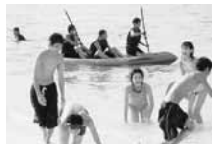
ホテル前のビーチで海水浴