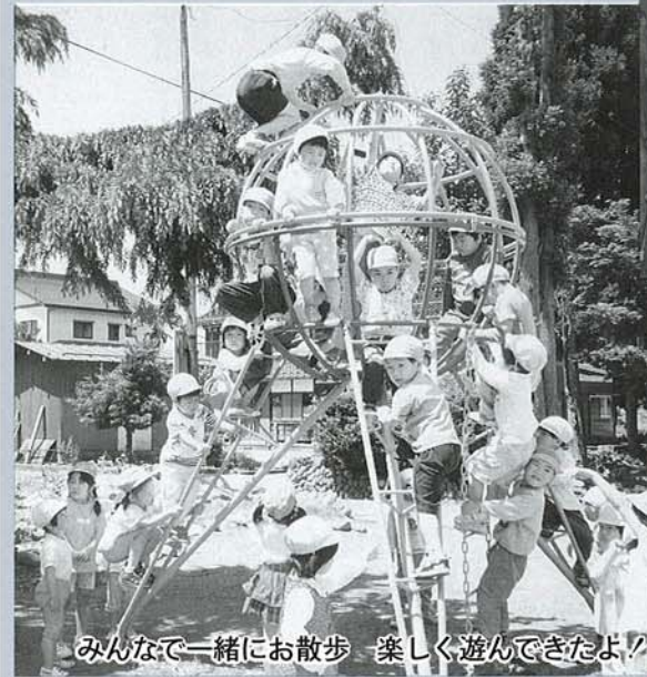
みんなで一緒にお散歩 楽しく遊んできたよ!