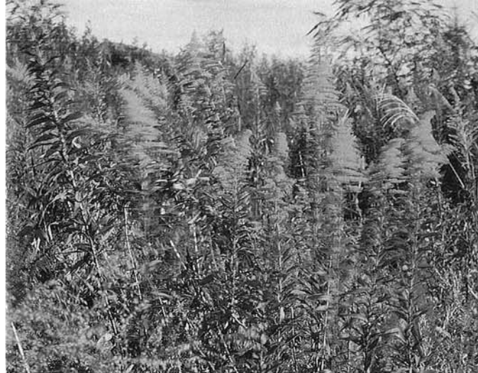
セイタカアワダチソウ

帰化植物というのは、一般的に人間が外国との交流によって、無意識のうちに国内に持ち込まれた植物で、野生の状態では生育しているものをいいます。時代区分では三つのグループに分類されます。 一つは、有史以前に人間が大陸あるいは北方や南方から日本列島に移り住んだ事を想定して、イネに随伴して侵入したと考えられる史前帰化植物です。 二つ目は、時代が経過し、畑作物と共に入ってきたと考えられる旧帰化植物です。 三つ目は、江戸時代以降、外国との貿易などで輸入品に混じって、あるいは人などに付着して国内に入り、伝播した新帰化植物です。 このような事から、越路町での帰化植物は、水田やその周辺の湿地で見られるものも多くは史前帰化植物です。また、生育地が主に畑地で、春に開花し、夏に結実する植物群の一部が旧帰化植物ですが、両者を帰化植物と判断することは困難です。 そこで、一般的に帰化植物という新帰化植物を指す場合が多く、ここでも新帰化植物を取り上げます。