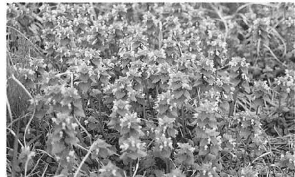
(上) ブタクサ (下) ヒメオドリコソウ