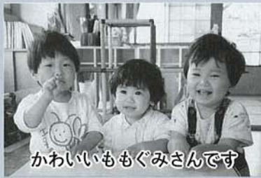
かわいいももぐみさんです