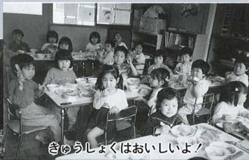
ぎゅうしょくはおいしいよ!