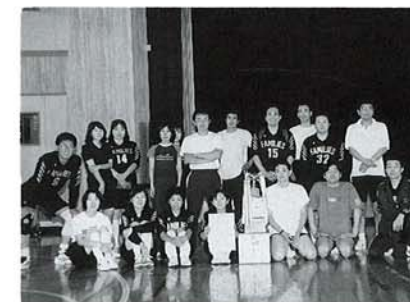
▲浦中ファミリーズA