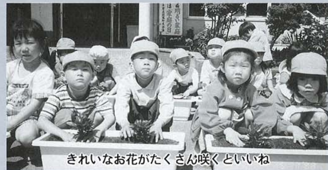
きれいなお花がたくさん咲くといいね