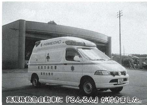
高規格救急自動車に『るるん』が付きましました。