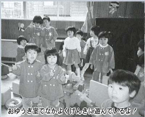
おゆうぎ室でなかよくげんきに遊んでいるよ!