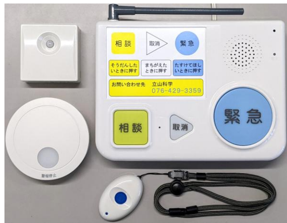
【固定電話回線使用タイプ】