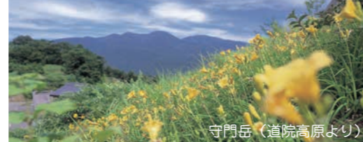
守門岳(道院高原より)