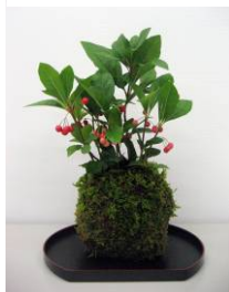
▲コケ玉のイメージ。 材料は異なります

期 日：1月24日(金) 時 間：午前10時～11時30分 講 師：NPO法人 花いっぱい推進協議会 材料費：1,500円 定 員：25人(先着) 申込み：12月11日(水) ～1月16日(木)