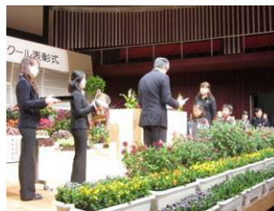
【2】各賞代表団体へ賞状授与