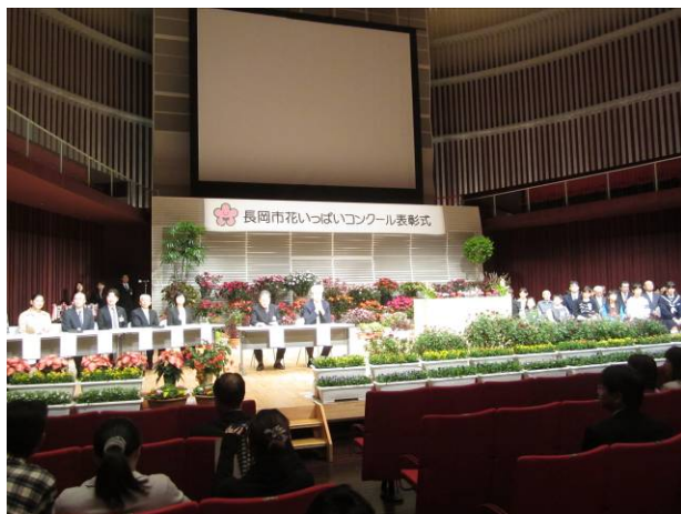
【1】リリックホールで10月26日、第18回長岡市花いっぱいコンクール表彰式が行われました。第1部では賞状授与、第2部では活動発表、じゃんけん大会を開催。