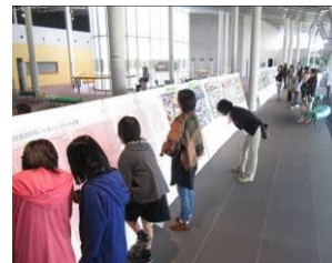
【5】コンクール作品展