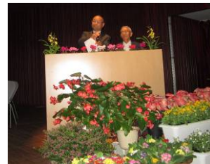
【3】最優秀賞団体の活動発表