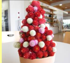
(写真はイメージです)

色があせにくいのでドライフラワーに最適です。4色の中から好きな色を組み合わせで作ります→