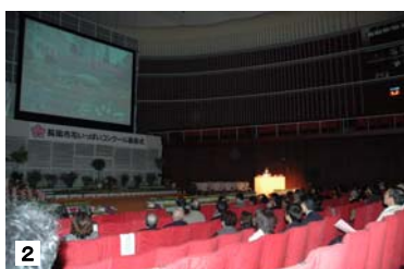
【2】最優秀賞団体から花いっぱい活動を発表していただきました。