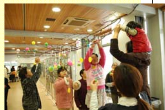
▲昨年のまゆ玉飾り