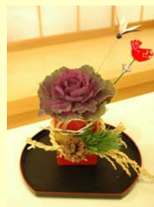
▲お正月に飾れます