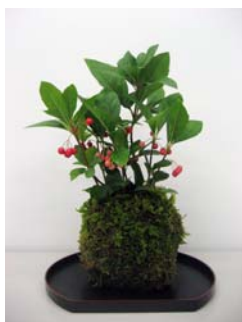
▲コケ玉のイメージ。 材料は異なります