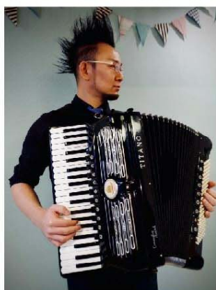
都丸智栄 / アコーディオン奏者

映画：「火花」「泣きたい私は猫をかぶる」 「名探偵コナン～緋色の弾丸」「ザ・ファブル」 「大江戸グレートジャーニー」「コレナンデ商会」 「教場II」「音楽の日」「オロナミンC」 「ダンス・ダンス・ダンスール」and more!!!